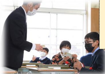
担任による最後の授業