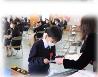
一人一人に手渡された 卒業証書